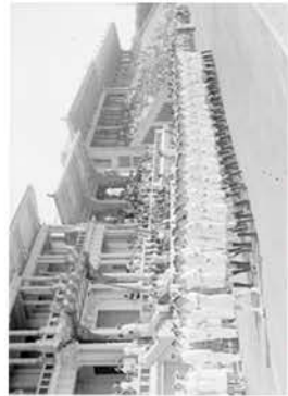
احتفال قوات الخدمة بعد الشكر بعد النصر في الحرب العالمية الثانية - استاد الإسكندرية ١٩٤٥