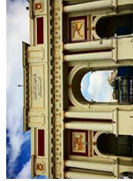
صورة حديثة لبوابة الماراثون ٢٠١٨