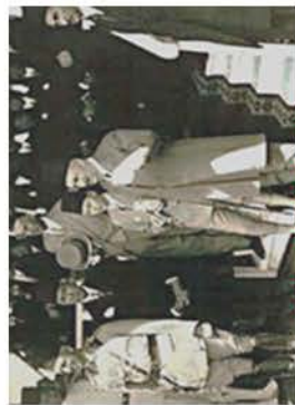
ملك فؤاد الأول والأمير فاروق في حضور حفل افتتاح استاد الإسكندرية ١٩٢٩