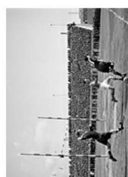
مباراة رجس لم قلعتها على استاد الاسكندرية بين قوات المحاف الدولية ومصر ١٩٢٢